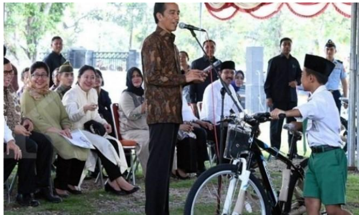
Gambar 1 Presiden Jokowi bagi-bagi sepeda

Satu dari simbol yang ditunjukkan oleh Jokowi adalah sepeda, yang digunakan sebagai hadiah untuk kuis yang beliau ajukan. Orang-orang yang berhasil menjawab pertanyaan kuis tersebut berkesempatan untuk memenangkan sepeda seperti yang ditunjukkan pada Gambar 1. Awalnya, Jokowi mengklaim bahwa sepeda dijadikan hadiah karena harganya yang terjangkau. Namun, selain alasan itu, terdapat alasan filosofis yang beredar bahwa sepeda dianggap sebagai simbol kerja keras, di mana kecepatan sepeda akan bertambah jika dikayuh atau digerakan dengan kuat, begitu juga sebaliknya sepeda tidak akan bergerak maju bahkan akan jatuh karena hilang keseimbangan akibat tidak dikayuh dengan kuat. Mengutip dari SerbaSepeda Blog, setidaknya Jokowi pernah mengutarakan lima alasan tentang pemberian sepeda sebagai hadiah, salah satunya adalah sepeda dianggap sebagai simbol kemandirian dan kerja keras (serbasepeda.com, 2019). Filosofi ini menggambarkan bahwa hasil yang baik akan diperoleh dari usaha yang keras, sementara usaha setengah-setengah hanya akan menghasilkan prestasi yang seadanya. Selain itu, alasan lain penggunaan sepeda adalah karena sifatnya yang ramah lingkungan, yang dapat dianggap sebagai solusi terhadap masalah lingkungan.