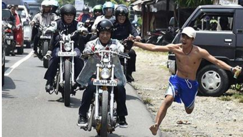
Gambar 5 Antusias salah satu warga lokal menyambut kedatangan Jokowi yang mengendarai Motor Choper.

Gambar 5 menunjukkan momen unik saat Presiden Jokowi mengunjungi daerah Pesanggrahan Tenjo, Pantai Pelabuhan Ratu, Sukabumi. Hal tersebut menjadi unik karena jarang terjadi. Penggunaan sepeda motor chopper oleh seorang pemimpin negara seperti Presiden Jokowi adalah suatu hal baru yang belum pernah dilakukan oleh para pemimpin sebelumnya.