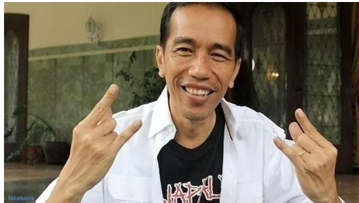
Gambar 4 Jokowi Penggemar musik metal

Sejak menjabat sebagai gubernur DKI Jakarta, Jokowi telah dikenal sebagai seorang pemimpin yang memiliki minat pada musik metal. Beberapa kali, media telah memperhatikan kehadiran Jokowi dalam acara-acara musik metal, contohnya ketika beliau menghadiri konser Metallica pada tahun 2013 di Stadion Gelora Bung Karno. Kehadiran sosok Jokowi pada saat itu cukup menarik perhatian, terutama dari kalangan anak muda yang memiliki minat serupa. Menurut (Limilia & Ariadne, 2018), remaja tidak mempunyai ketertarikan terhadap dunia politik, para remaja berpendapat bahwa politisi dan partai tidak bisa menjawab permasalahan bangsa. Berdasarkan pada hal tersebut maka diperlukan strategi dan juga cara kreatif yang tidak biasa untuk bisa menarik minat anak muda terhadap politik. Memperlihatkan sebagai penyuka musik metal bisa menjadi salah satu cara yang dilakukan untuk menarik minat anak muda, mengingat komunitas musik metal di Indonesia yang didominasi oleh anak muda menjadi salah satu komunitas terbesar jika dibandingkan dengan beberapa negara lain. Jeremy Wallach dalam risetnya yang berjudul "Metal Rules the Globe: Heavy Metal Music Around the World", mengatakan bahwa Indonesia memiliki salah satu skena musik metal terbesar di dunia. Indonesia merupakan negara yang merupakan bagian "fase kedua" globalisasi musik metal (Wallach, BERGER, & GREENE, 2011).