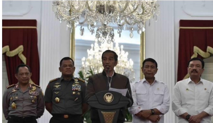
Gambar 2 Presiden Jokowi mengenakan Jaket Bomber pada saat berpidato

yang dipicu oleh pernyataan kontroversial Gubernur DKI Jakarta saat itu. Terlepas dari pembahasan pidato Jokowi tentang isu demo tersebut, perhatian masyarakat justru lebih terfokus pada jaket yang dikenakannya. Dengan demikian, jika tujuan penggunaan jaket tersebut adalah untuk mengalihkan perhatian, maka simbol yang digunakan oleh Jokowi dapat dikatakan berhasil.