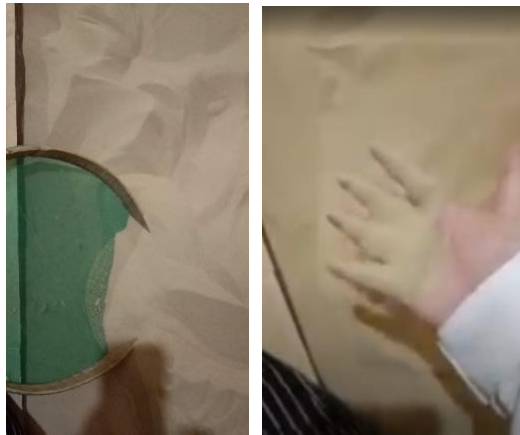
Gambar 3. Kualitas pasir untuk kasur pasir (2023)

keluarga A, pasir yang ada di halaman klaster biasanya adalah pasir yang telah dipindahkan dari kasur pasir di kamar tidur setelah 6 bulan pemakaian.