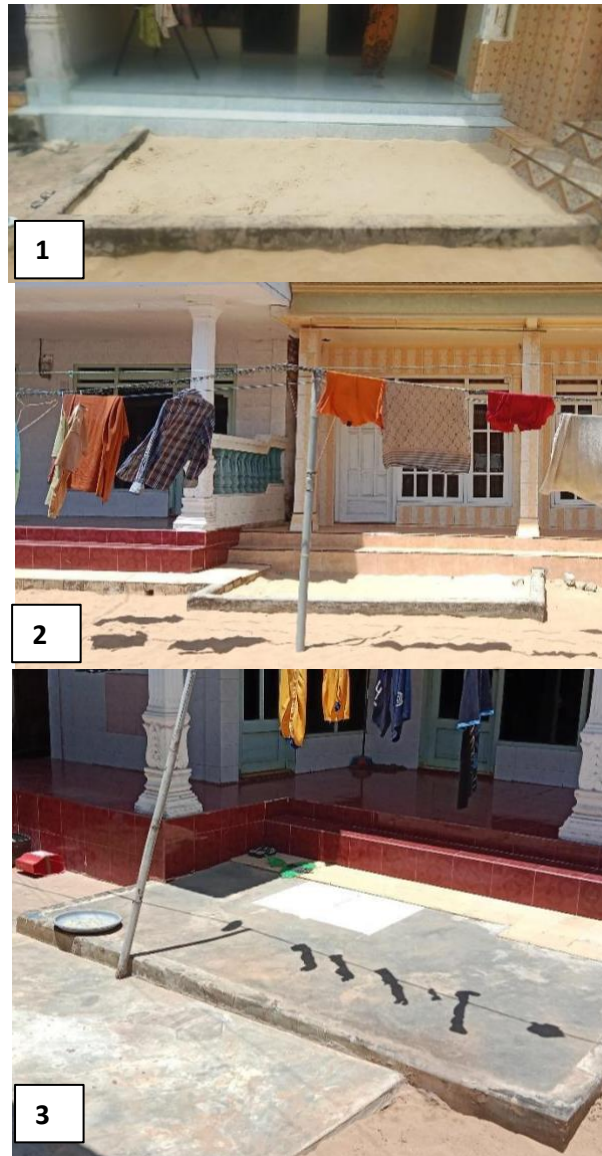
Gambar 2. Kasur pasir 1, kasur pasir 2 dan kasur pasir 3 (gambar dibaca dari atas ke bawah) (2026)

difungsikan lagi) sejak beberapa tahun lalu. orientasi rumah seluruhnya berhadapan, sehingga kasur pasir berada di antara rumah-rumah di dalam klaster. Posisi ini memungkinkan kasur pasir 1 menjadi fokus perhatian dan orientasi aktivitas sehingga dalam diagram Ching (2007) elemen pusat sering digunakan menjadi titik berkumpul aktivitas.