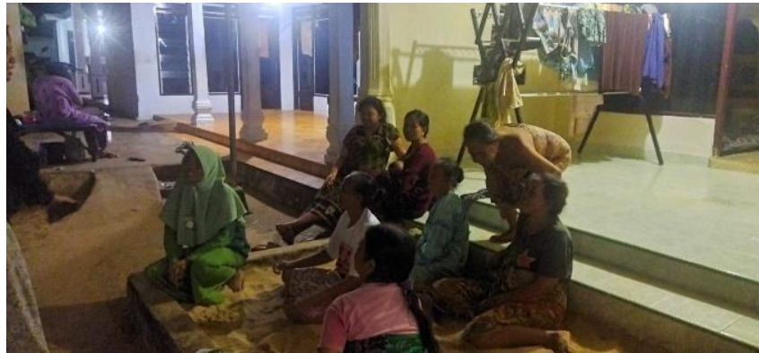
Gambar 5. Kasur pasir di halaman klaster sebagai tempat berkumpul anggota keluarga (2025)

dan agama. Dalam pola hunian di Kampung Kasur Pasir, kasur pasir di halaman klaster lah yang menjadi tempat berkumpul sehingga solidaritas tersebut tercipta. Di titik ini, terjadi pergeseran makna: dari ruang komunal yang bersifat kolektif menjadi ruang transaksional yang terbuka terhadap interaksi sosial yang lebih luas. Pendekatan Norberg-Schulz (1980) tentang existential space juga relevan di sini, dimana kasur pasir tidak hanya diposisikan sebagai elemen fisik, melainkan sebagai tempat yang mengandung makna keberadaan dan keterikatan emosional warga terhadap lingkungannya.