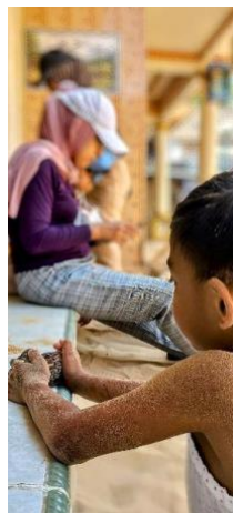
Gambar 6. Salah satu anak dari keluarga A sedang bermain dengan binatang peliharaannya di kasur pasir di halaman klaster

Selain sebagai ruang pengalaman awal kehidupan, kasur pasir di halaman klaster juga berfungsi sebagai ruang reproduksi memori sosial dalam kehidupan keluarga. Narasi yang disampaikan oleh anggota keluarga A menunjukkan bahwa pengalaman bermain, bercengkrama, dan berinteraksi di atas kasur pasir menjadi bagian dari memori kolektif yang terus diingat oleh anggota keluarga hingga dewasa. Dalam observasi lapangan, fenomena ini masih dapat dilihat pada generasi anak-anak yang saat ini menggunakan kasur pasir sebagai tempat bermain. Ketika penelitian dilakukan, seorang anak berusia lima tahun dari keluarga A terlihat bermain dengan binatang peliharaannya di atas kasur pasir di halaman klaster (gbr 6). Aktivitas tersebut memperlihatkan bagaimana praktik penggunaan kasur pasir terus direproduksi secara lintas generasi, sehingga ruang tersebut tidak hanya menyimpan memori masa lalu, tetapi juga menjadi medium pembentukan pengalaman baru bagi generasi berikutnya.