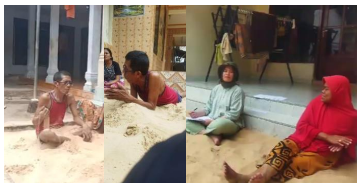
Gambar 4. Gestur-gestur warga ketika berinteraksi dengan tamu di kasur pasir (2025)

Fitur-fitur fisik pada kasur pasir menyebabkan beberapa gestur yang penulis lihat dari observasi lapangan. Pertama, bentuk kasur pasir yang memanjang seperti kasur, memungkinkan warga dalam posisi duduk, maupun berbaring sambil meluruskan dan merentangkan kaki (tentunya jika hanya sendiri atau hanya beberapa orang saja di kasur pasir). Menurut Gibson (Lawson, 2001) konsep affordances mencakup karakteristik lingkungan yang memberi petunjuk atau isyarat tentang cara penggunaannya. Melalui persepsi aktif fitur-fitur ini dapat dimaknai secara beragam, bergantung pada pandangan individu maupun interpretasi kolektif yang pada akhirnya membentuk pemahaman sosial budaya yang berkembang di dalam masyarakat. Fitur-fitur pada kasur pasir memberikan petunjuk mengenai gestur, posisi, dan bentuk interaksi yang muncul. Seperti yang dikatakan oleh Fathony (2009), bahwa perilaku sebagai bentuk dari reaksi fisik dan non fisik dari manusia terhadap kondisi lingkungan. Tekstur pasir menyebabkan adanya gerakan menikmati tekstur pasir sambil berbincang, dengan cara menaburkan pasir ke atas tubuh secara berulang. Gestur-gestur tersebut dapat terlihat pada gambar 4.