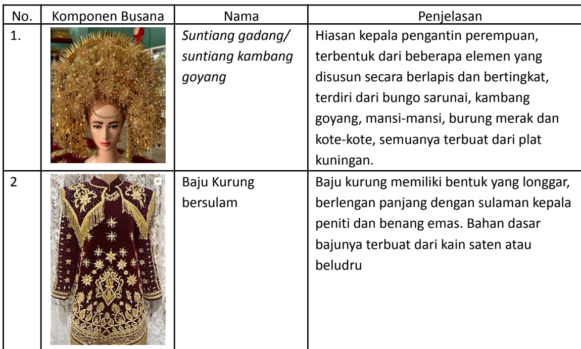
Tabel 1. Komponen Busana Pengantin Perempuan