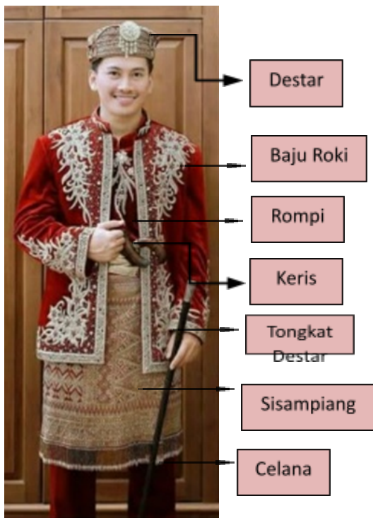
Gambar 2. Struktur Busana Pengantin laki-laki