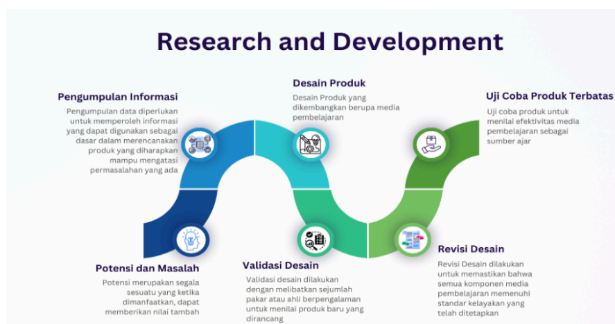
Gambar 1. Alur Pengembangan Produk

Metode yang digunakan dalam penelitian ini adalah Research and Development yang mengacu pada model Borg & Gall (Chusnah et al., 2023; Ulfa & Nasryah, 2020). Metode ini memiliki potensi besar untuk meningkatkan produktivitas dan kualitas pendidikan melalui pengembangan berbagai inovasi seperti media pembelajaran, bahan ajar, metode pengajaran dan lainnya. Penelitian ini bertujuan untuk mengembangkan sebuah media pembelajaran berupa pop-up book tari Sunda sebagai pengenalan muatan lokal peserta didik sekolah dasar. Penelitian ini dilakukan secara terbatas hingga tahap ke-enam yaitu uji coba produk. Uji coba ini dapat dikatakan uji terbatas, yaitu tahap pengujian yang dikembangkan dalam lingkungan yang terbatas. Berikut ini merupakan alur pengembangan produk: